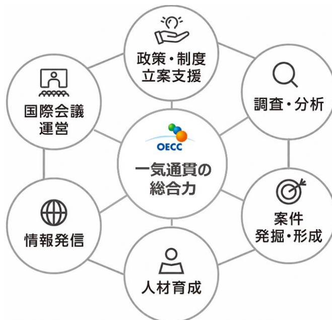
図3 OECCの強みを発揮した総合力の有機的展開

本中期計画では、これまでの事業実績に基づく OECC の強みを一層発揮し、下記の通り、中核的活動領域における取組を幅広く展開していく。