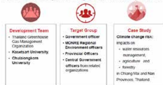
Experience on developing a THAI Training course on "Climate Change Adaptation"

一方、ASEAN加盟国からの参加者を対象としたコースでは、現在、気候変動の適応策に関するコースを開発中です。気候変動適応策に係る政策立案・実行の主流化のための実践的な訓練を英語で実施します。このトレーニングの対象としては、各国から