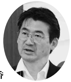
環境省 環境事務次官 森本英香

本日は、G20サミットに向けた我が国の取組について最新情報を交えつつお話し致します。G20参加国の間では貿易問題などに象徴される課題が山積する中、環境の分野については、かなり大きな進展が見られます。